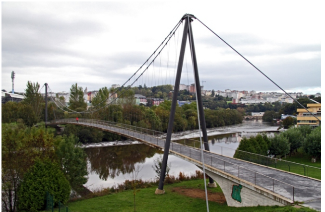
Pasarela sobre o Miño.