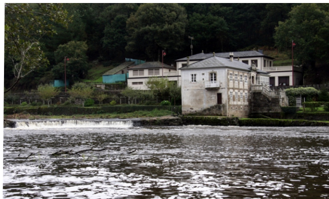
Acea do Rei Chiquito.