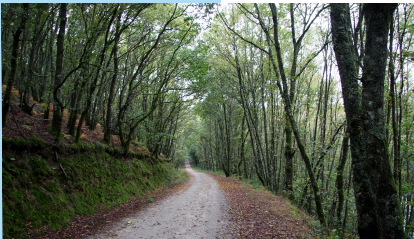
Camiño no o bosque río arriba.