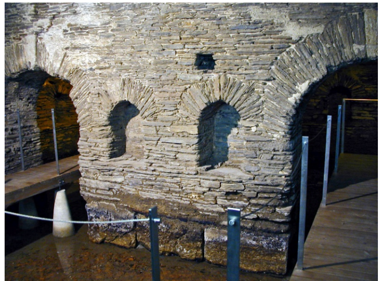
Restos das Termas Romanas de Lugo que se poden visitar no interior do balneario. Construídas entre os século I e II.

Un carreiro duns 450 m, bastante estreito e pouco coidado, ou continuando pola beira da estrada medio quilómetro, permite enlazar esta ruta coa do río Rato. No carreiro hai un par de sitios desde os que se ve o caneiro de Santalla e a illa do río, difícil de apreciar porque o tamaño da illa e a vexetación impiden percibila en toda a súa extensión