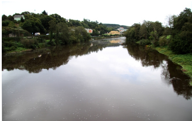
O Miño augas arriba, desde e ponte romana.