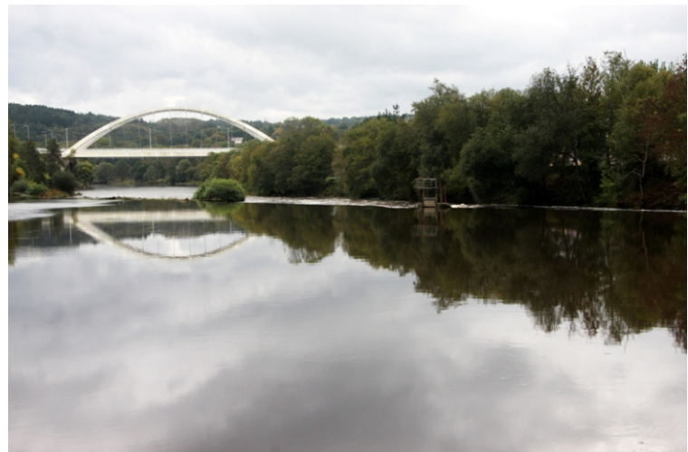
O Miño, o caneiro das Olgas e a ponte nova da estrada de Portomarín.