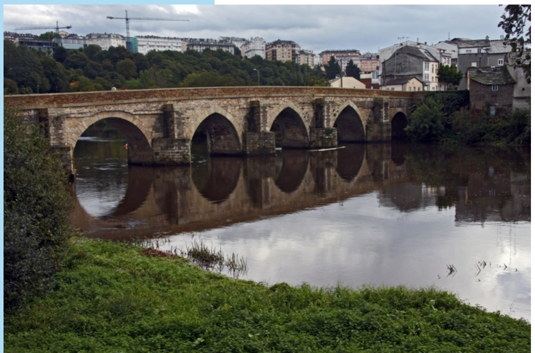
Ponte romana sobre o Miño