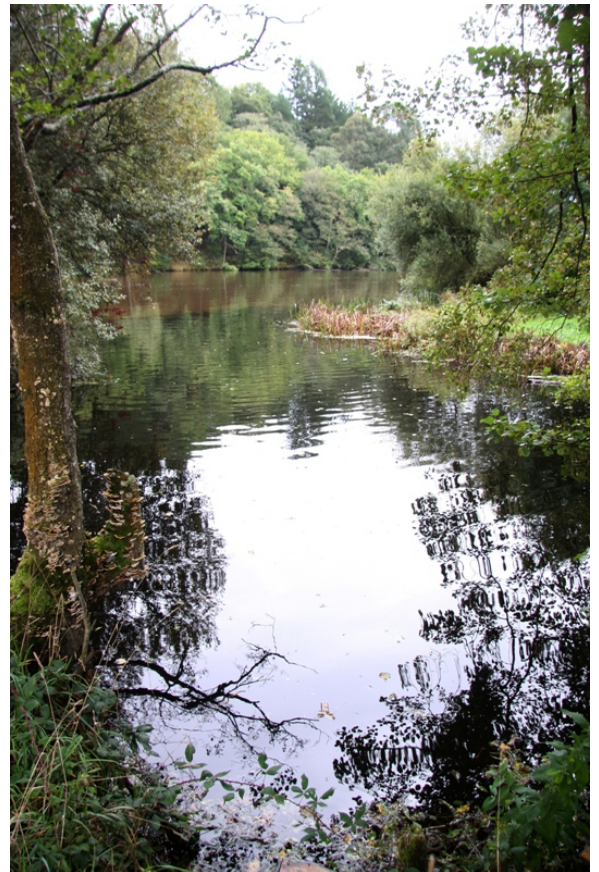
Desembocadura do río Mera ou dos Muíños, no Miño.

Ao pé da ponte romana hai un aparcamento onde está situado o inicio da ruta para o tramo de augas arriba, e aínda que o roteiro oficial inicia o camiño cruzando a ponte, remontando logo a corrente pola dereita, nos suxerimos facelo do revés e remontar o río pola marxe esquerda, porque ademais de non ter perda posible vainos permitir facer os tramos nos que se camiña ao pé da estrada pola esquerda, tal e como indica o código da circulación para os peóns, e ademais, desta maneira, podemos evitar volver pola estrada o tramo de río acotado polo club fluvial cruzándoo antes de chegar pola nova pasarela peonil que nos devolve ás proximidades do aparcamento, sen perda nin menoscabo de ningún elemento de interese do río ou do seu contorno.